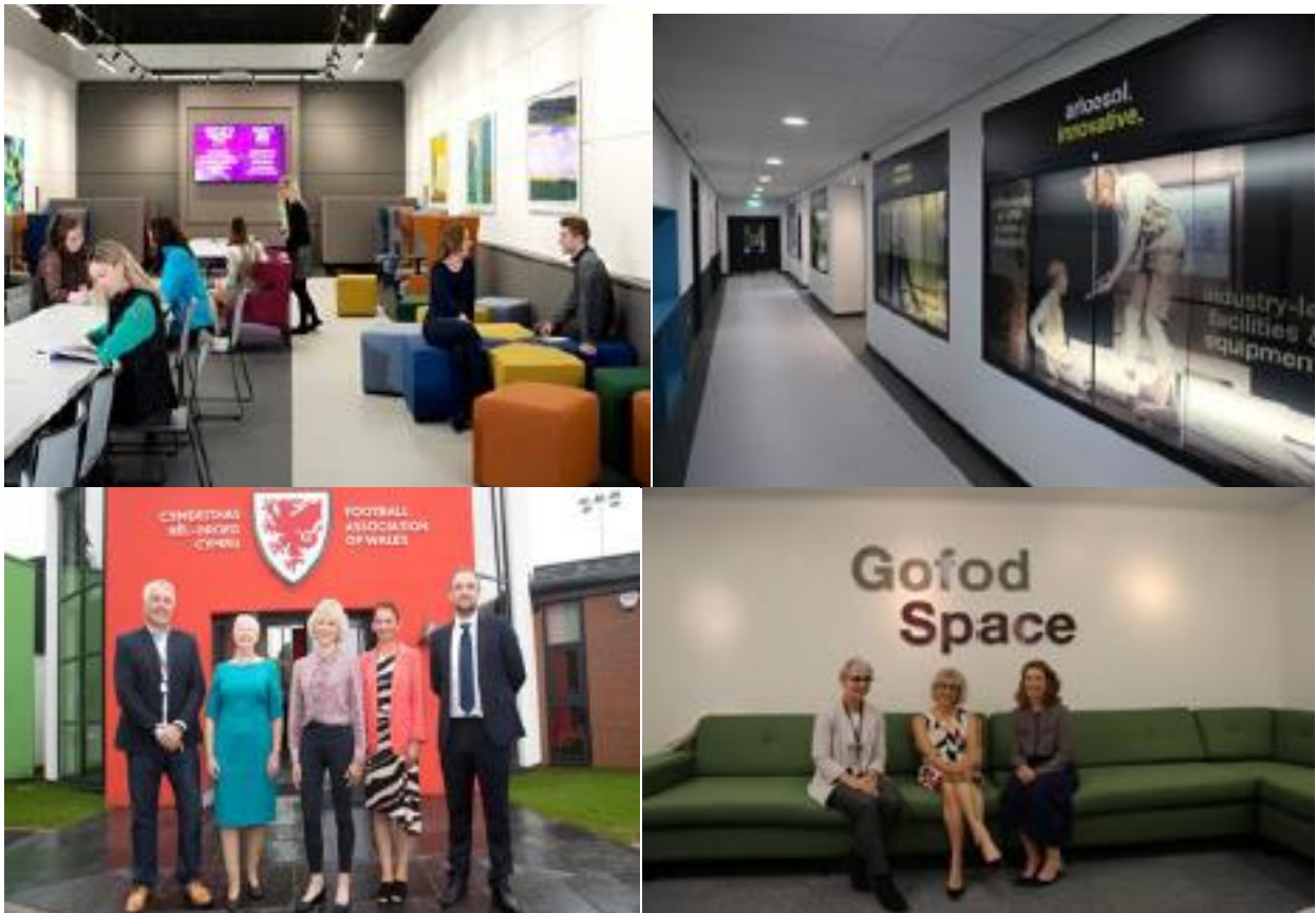
[Lluniau'r prosiectau Campws 2025 a gyflawnwyd yn 2019]

Mae'r Brifysgol yn parhau i gynnig cymuned fywiog, gyfeillgar a chefnogol gyda system tiwtor personol i gynorthwyo unigolion i gyrraedd eu potensial trwy ragoriaeth academiaidd. Y cyfraniadau gan bob rhan o'r brifysgol, aelodau staff unigol a'n gradddedigion sy'n creu llwyddiannau'r Brifysgol.